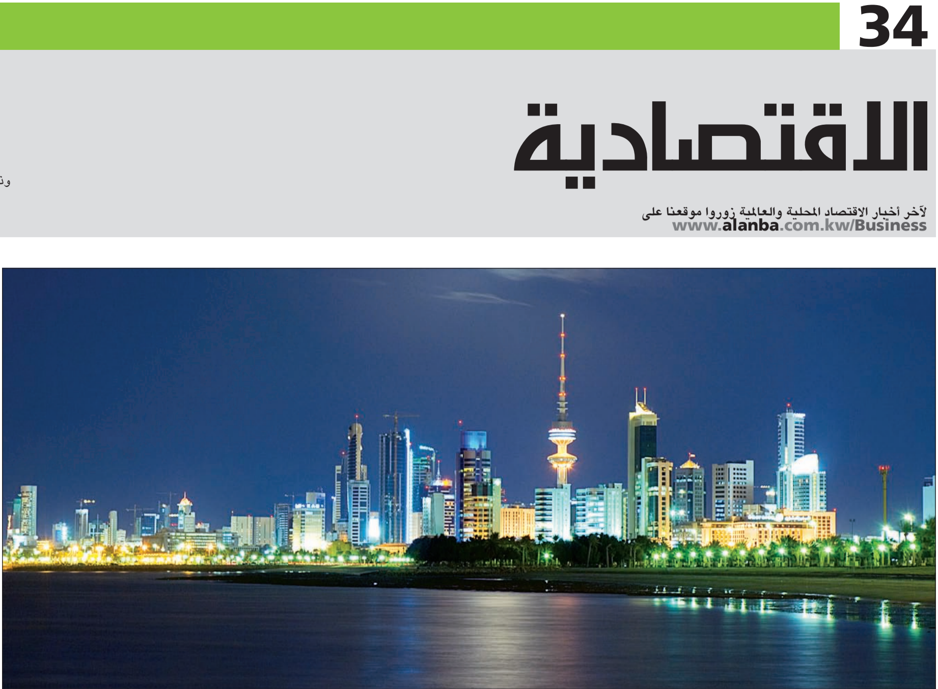
الحكومة تؤكد التزامها بخطة المشروعات التنموية رغم تراجع أسعار النفط

وأوضحته في بيان على موقع البورصة أمس أن فترة التعديل ستكون من أمس (الثلاثاء) 3 مارس وحتى (الاثنين) 23 مارس الجاري. ونوهت الشركة بأن باب الاكتتاب سيتم إغلاقه مباشرة قبل انتهاء فترة التمديد حال تغطية كامل الاكتتاب في قيمة الدفعة الأولى من الزيادة.